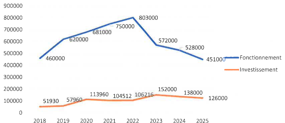
Evolution des budgets de fonctionnement et d'investissement du SMBCVB

Le budget 2025 se concentre sur la finalisation de la révision du SCoT, avec des montants d'étude en diminution mais des amortissements en hausse. Le budget de fonctionnement poursuit sa tendance à la baisse. Plus de la moitié du budget de fonctionnement est constitué des subventions liées aux Plans de Déplacements Mutualisés, qui vont être redistribuées cette année (250 000 €).